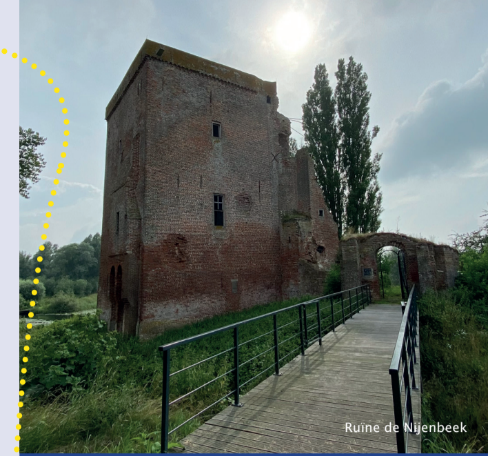
Ruïne de Nijenbeek

Deze plek wordt al eeuwenlang bewoond door de familie Krepel. Eerst exploiteerden zij een koperslagerij, later een houtzagerij. Vanaf 1950 worden hier deuren vervaardigd. Tegenwoordig is een deel van het complex ontwikkeld tot een B&B-, trouw- en vergaderlocatie. Op de Open Monumentendag zijn de monumentale fabrieksgebouwen open en ook het nieuwe fabrieksmuseum is te bewonderen. Hierin is de geschiedenis van het industriële complex vanaf 1732 te zien in tekst, beeld en objecten. Ook de gerestaureerde tuinmanswoning, nu in gebruik als vergaderruimte, zal opengesteld zijn. Verder zullen de plannen voor het herstel van de watergangen, de beek en de molenvijver (Wierd) uit de doeken gedaan worden. Ook hoort u iets over de plannen om een hypermodern waterrad te plaatsen op de plek waar ooit de watermolen stond, om eigen energie te kunnen opwekken.