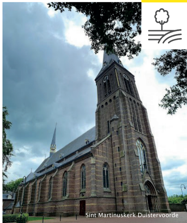
Sint Martinuskerk Duistervoorde