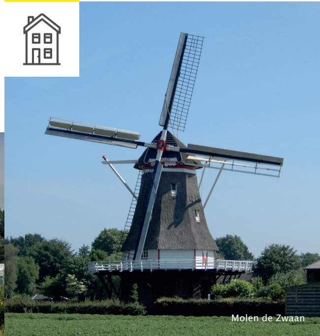
Molen de Zwaan