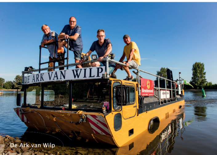
De Ark van Wilp

Ga jij ook deze Open Monumentendag op weg? Bewonder een monument, bezoek een activiteit, beklim een kerktoeren of neem een pauze met wat drinken en lekkers. Onderweg zul je van alles tegenkomen! We wensen je een hele leuke reis vol mooie bestemmingen toe!