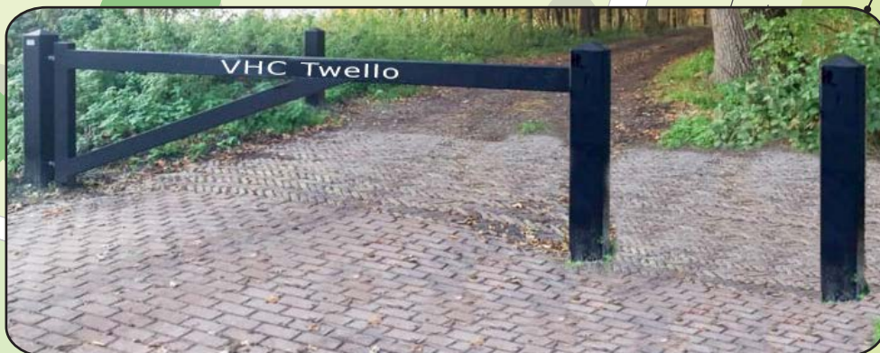
toegang met slagboom en doorgang voor wandelaars en fietsers