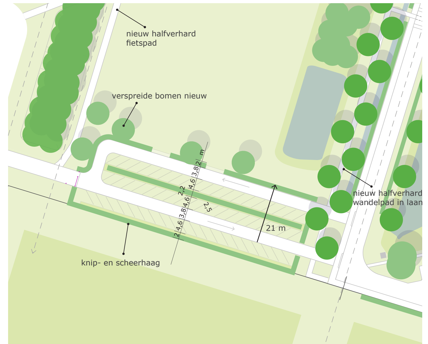
PLAN 55 parkeerplekken