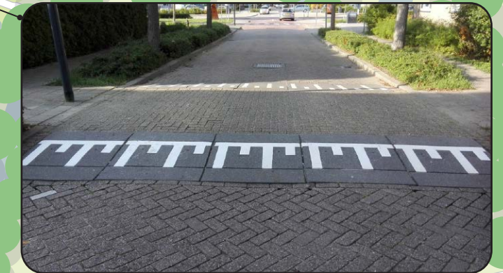
drenpel bij oversteek wandelaars