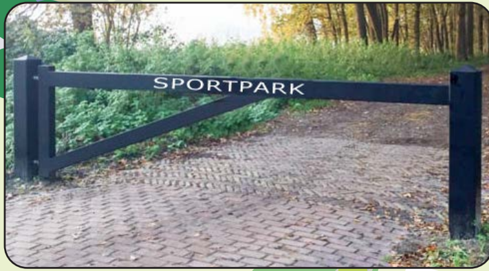
landhekken / slagbomen als toegangspoort